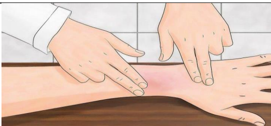
ناحیه را از نظر علائم بروز سوختگی بررسی نمایید.