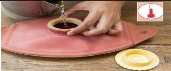
آب گرم ۴۰ درجه را داخل کیف آب گرم بریزید به طوری که یک دوم کیسه پر شود