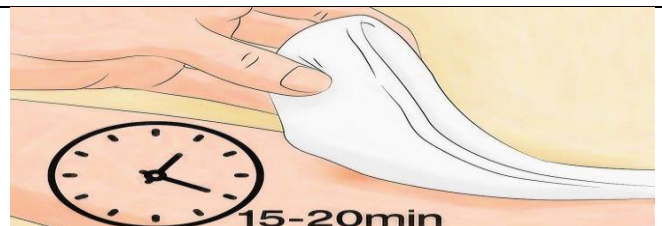
کیف آب گرم را هر ۱۵ دقیقه از روی محل به مدت ۵ دقیقه بردارید.