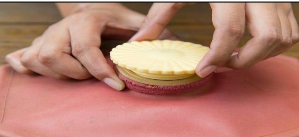
در کیف آب گرم را ببندید و از عدم نشست مایع از آن اطمینان حاصل کنید.