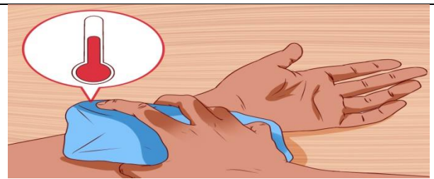
کیف آب گرم را در یک حوله کلفت بپیچید و روی محل قرار دهید