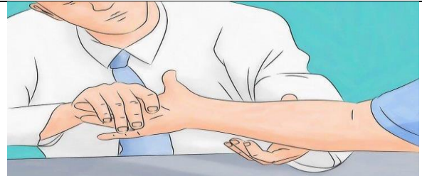
ناحیه نیازمند کیف آب گرم را ارزیابی نمایید.