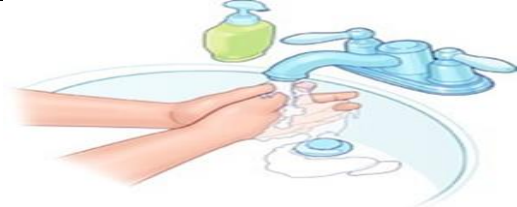
دست ها را بشویید.