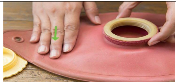
هوای باقیمانده در کیسه را تخلیه کنید