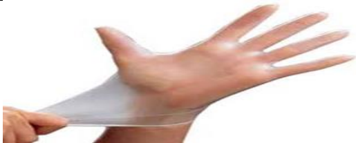
دستکش یکبار مصرف تمیز بپوشید.