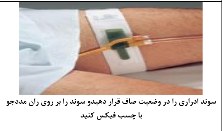
سوند ادراری را در وضعیت صاف قرار دهید و سوند را بر روی ران مدجو با چسب فیکس کنید