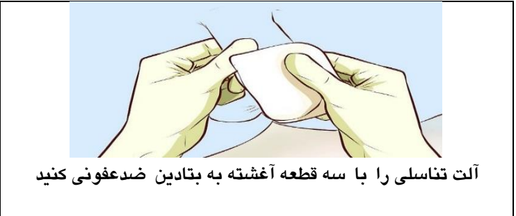
آلت تناسلی را با سه قطعه آغشته به بتادین ضد عفونی کنید