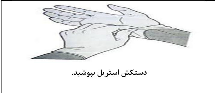
دستکش استریل بپوشید.