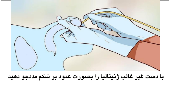
با دست غیر غالب ژنیتالیا را بصورت عمود بر شکم مدجو دهید