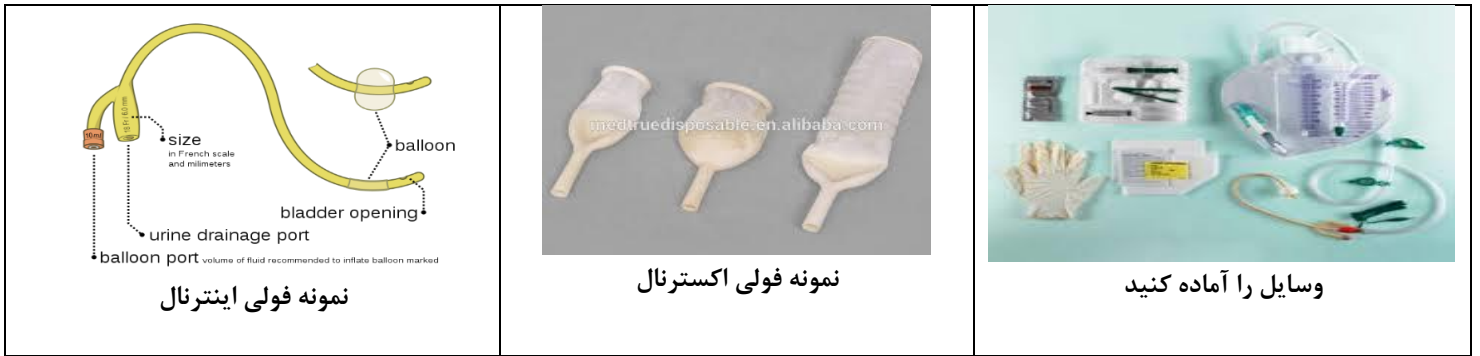
نمونه فولی اینترنال