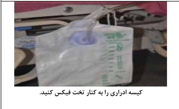
کیسه ادراری را به کنار تخت فیکس کنید.