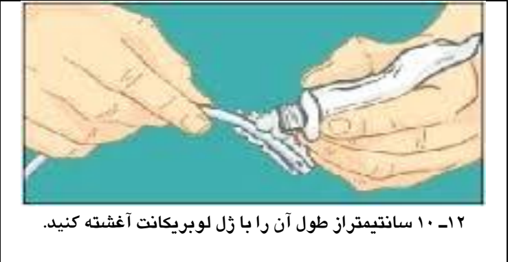
۱۰-۱۲ سانتیمتر از طول آن را با ژل لوبریکانت آغشته کنید.