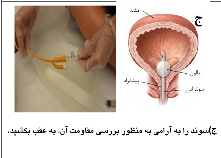
ج) سوند را به آرامی به منظور بررسی مقاومت آن، به عقب بکشید.